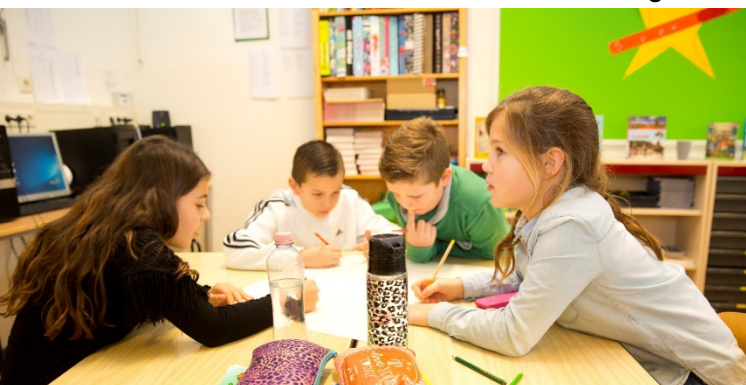
doelmatig te plannen