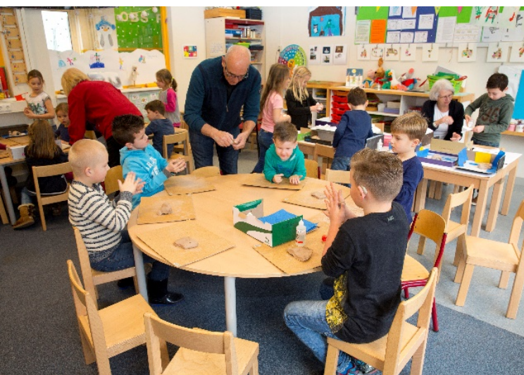
De thema's van de workshops worden aan het einde van elk schooljaar bepaald.

Wekelijks is dit te zien in het hoekenwerk. Een van de hoeken heeft altijd met techniek te maken. Daarnaast worden de grotere opdrachten verwerkt in workshops.